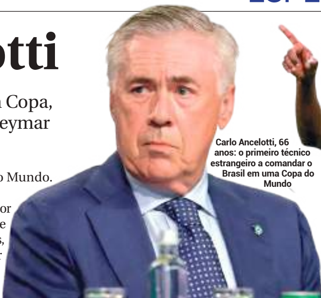
Carlo Ancelotti, 66 anos: o primeiro técnico estrangeiro a comandar o Brasil em uma Copa do Mundo

A Seleção Brasileira passou por quatro treinadores no ciclo entre 2023 e 2026 — Ramon Menezes, Fernando Diniz, Dorival Júnior e Carlo Ancelotti — e testou 94 jogadores ao longo dessa jornada. Agora, com o grupo definido, o país inteiro torce para que a instabilidade dos últimos anos tenha ficado no passado.