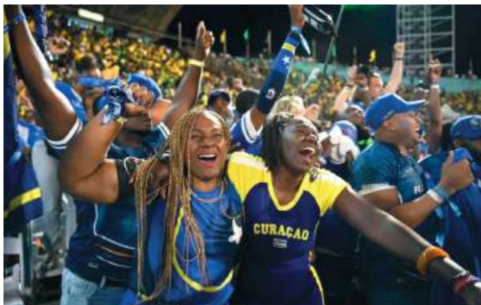
Torcedores de Curaçao comemoram vaga inédita na Copa do Mundo

Cabo Verde se torna ainda a quarta nação de língua portuguesa a disputar uma Copa do Mundo, juntando-se a Brasil, Portugal e Angola. Sua estreia será no dia 15 de junho, contra a Espanha, atual campeã da Eurocopa e uma das favoritas ao título.