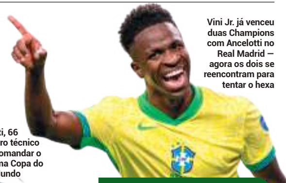
Vini Jr. já venceu duas Champions com Ancelotti no Real Madrid — agora os dois se reencontram para tentar o hexa