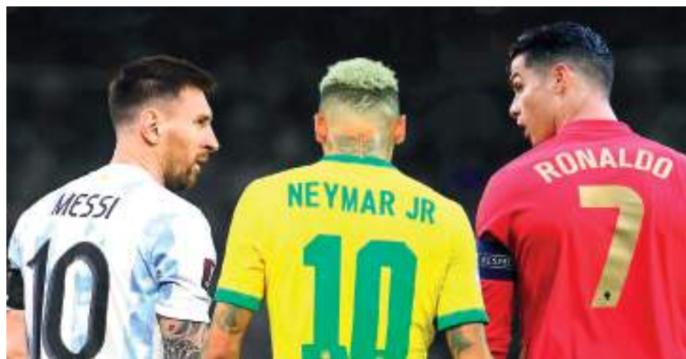
Messi, Neymar e Cristiano Ronaldo disputam sua última Copa

É a quarta Copa de Neymar. Estreou em 2014, quando o Brasil jogou em casa e foi até as semifinais — ele saiu lesionado nas quartas de final e não pôde jogar o traumático 7 a 1 contra a Alemanha. Em 2018 e 2022, o Brasil caiu antes do esperado. Agora, aos 34 anos, com o corpo marcado por cirurgias e o nome gravado na história como maior artilheiro da Seleção com 79 gols, ele entra em campo sabendo que não haverá outra oportunidade.