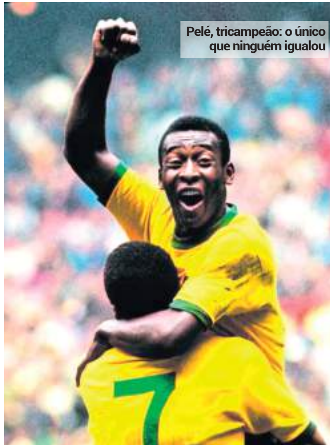
Pelé, tricampeão: o único que ninguém igualou

O recorde que Messi pode bater: Messi soma atualmente 13 gols em Mundiais — apenas três gols abaixo do recorde de Klose. Com uma boa campanha da Argentina em 2026, o argentino pode finalmente superar o alemão e se tornar o maior artilheiro da história do torneio.