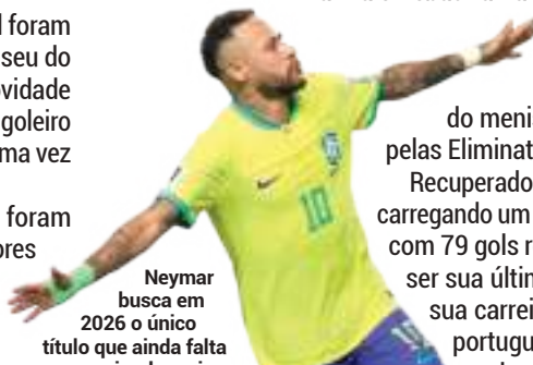
Neymar busca em 2026 o único título que ainda falta na carreira do maior artilheiro da história da Amarelinha

Na lista, sete atletas que atuam no futebol brasileiro foram chamados — o maior número desde 2022. Outros 15 jogadores atuam na Europa, dois na Arábia Saudita e dois na Rússia. A Premier League inglesa é o campeonato com mais representantes: oito convocados.