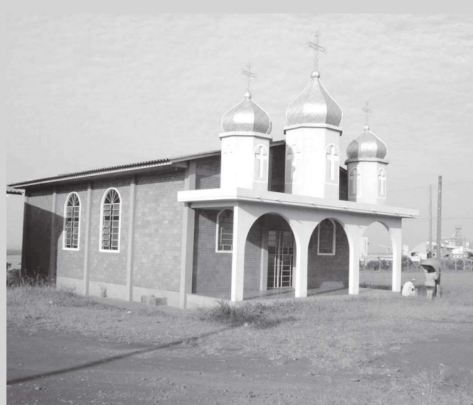
Igreja ucraniana em Centralito, primeiro local povoado pela comunidade eslava em Cascavel