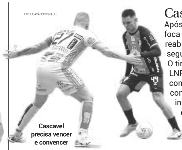
Cascavel precisa vencer e convencer