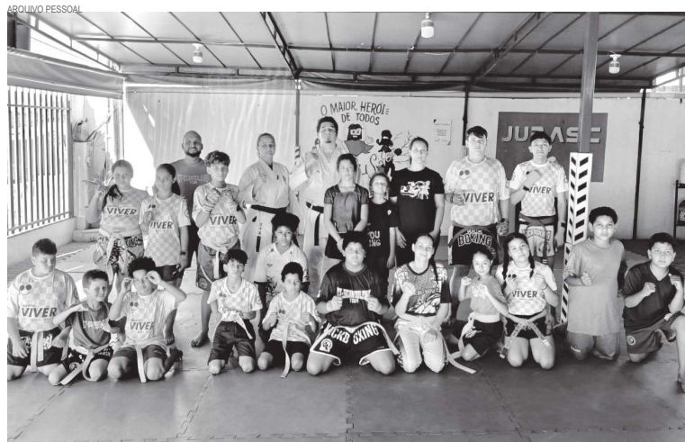
Equipe do Projeto Viver

Os frutos dessa preparação foram colhidos no Paranaense de Kickboxing, em Maringá. Unindo forças, os projetos locais levaram