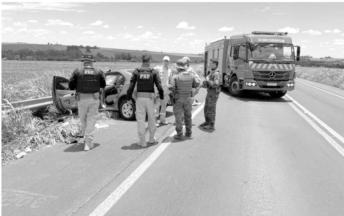
Motociclistas estão entre as principais vítimas, segundo estatísticas oficiais

As maiores cidades da região, Cascavel, Foz do Iguaçu e Toledo, articulam estratégias emergenciais para conter o que vem sendo tratado como uma verdadeira epidemia viária, diante de índices de letalidade que não eram observados em tão curto espaço de tempo nos últimos anos.