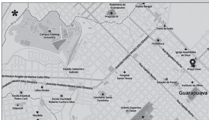
Mapa aponta a localização do Rio Cascavel (*) de Guarapuava

Para homenageá-lo, o Município de Cascavel deu seu nome a um parque ecológico e ainda a uma rua do Jardim Maria Luíza, paralela à Avenida Carlos Gomes. Foz do Iguaçu o lembra com o nome de uma avenida, justamente onde hoje se encontra o complexo universitário iniciado com a Unioeste. A história completa está contada no livro Cascavel: Uma Santa na Encruzilhada: https://x.gd/U6P3L .