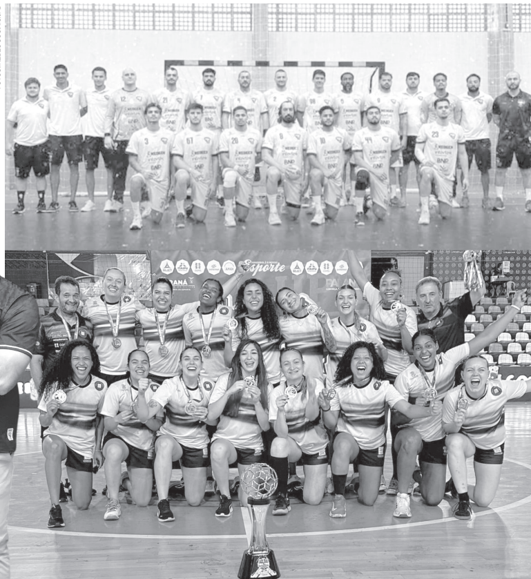
Equipes começam bem a temporada

Na sequência da temporada, o masculino terá compromissos importantes, incluindo a Copa