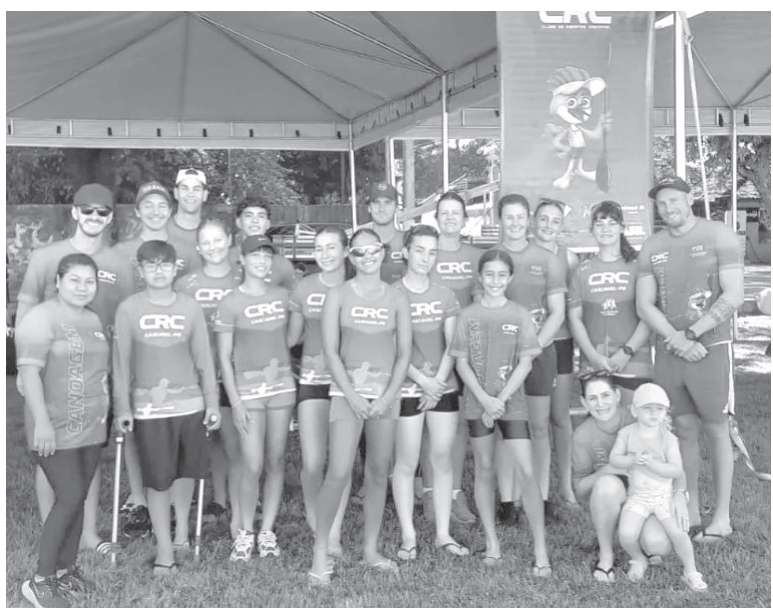
Equipe do CRC no topo da modalidade ASSESSORIA

Equipes de Cascavel participam da competição que começa nesta sexta-feira (17) e segue até terça (21), em Goioerê. O evento reúne mais de 1500 atletas e bate recorde de equipes. Cascavel estará representada no Masculino Juvenil e Infantil (Cascavel/AC5), no Feminino Cadete (A.C.H./Cascavel/Lanali) e no Masculino Adulto (A.C.H./Cascavel/Lanali). Serão mais de 1500 atletas em ação durante a competição.