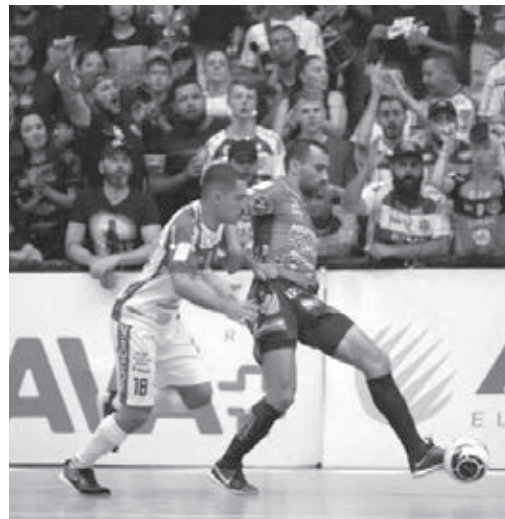
Cascavel x Pato. Rivalidade a flor da pele

O FC Cascavel se despede da Série D do Brasileirão neste domingo (21), enfrentando a equipe do Avenida de Santa Cruz do Sul (RS), vice-líder da competição. O time gaúcho foi derrotado pela Serpente Aurinegra na abertura da competição. A outra vitória do time cascavelense foi sobre o Concórdia (SC) e essas foram as duas únicas vitórias da equipe da Série D. Mesmo que vença a partida de despedida, o FC Cascavel termina o campeonato na lanterna do Grupo A8, coroadando uma participação digna de ser esquecida. A temporada, que começou com grandes expectativas, fecha de forma decepcionante, marcada por uma campanha pífia na Série D. Com apenas 2 vitórias em todo o campeonato, 6 empates e 5 derrotas, o time somou apenas 12 pontos. A partida de domingo está marcada para o Estádio Olímpico Regional, às 16h.