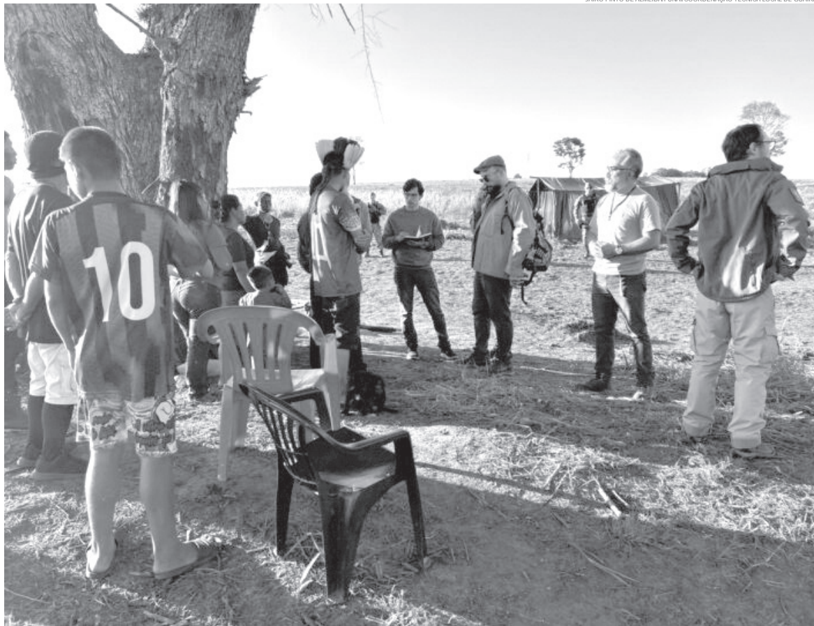
Invasores reivindicam a posse da Terra Indígena Guasu Guavirá, no município de Terra Roxa

O Secretário de Estado da Segurança Pública, coronel Hudson Teixeira, esteve em Terra Roxa na quarta-feira (17). Ele participou de uma reunião no Sindicato Rural da cidade, quando destacou a importância de uma resolução rápida para evitar mais violência. A estratégia inclui a intensificação do policiamento nas áreas