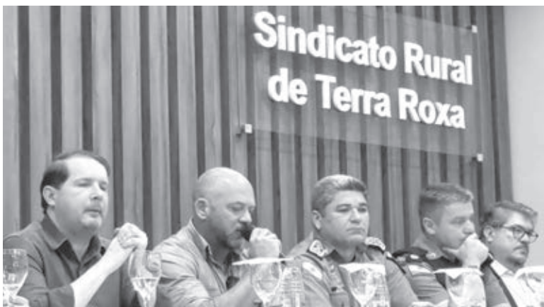
Reunião em Terra Roxa reuniu autoridades para debater a questão das invasões | PORTAL PALOTINA

Gilmar Mendes é relator das ações protocoladas pelo PL, PP e Republicanos, que pedem a validade do projeto de lei. Promulgada em janeiro, a lei do marco temporal define que os indígenas só têm direito às terras que estavam em sua posse até 5 de outubro de 1988.