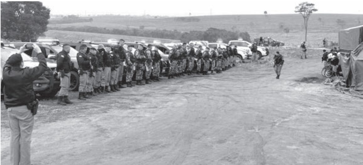
A Polícia Militar foi mobilizada para acompanhar a manifestação de agricultores contra a invasão de terras

presidente da Frente Parlamentar da Agropecuária (FPA). Em um vídeo publicado em rede social, Lupion afirma que é “mais um fato lamentável” que “os ditos indígenas [estejam] invadindo propriedades, se julgando no direito de tomar o que é dos outros”.