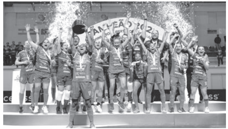
Meninas do Stein querem repetir a festa