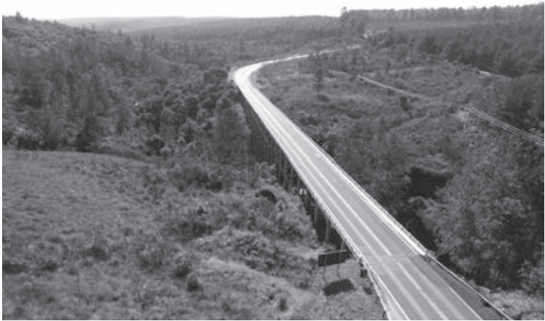
No total serão 920 estruturas que serão inspecionadas | DER-PR

manutenção e conservação de OAC, estruturas de contenção e dispositivos de drenagem são realizadas de forma pontual, conforme verificação visual realizada por técnicos das superintendências regionais do DER/PR que percorrem a malha em busca de patologias ou irregularidades, principalmente quanto a pavimento e sinalização.