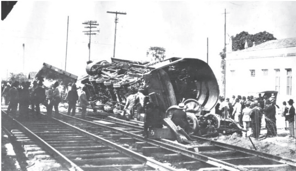
Locomotiva derrubada por uma bomba. Revolucionários se retiraram em espetacular operação ferroviária