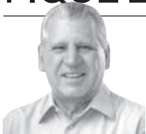
Dilceu Sperafico Deputado Federal