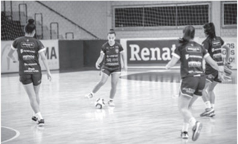
Equipe quer manter liderança da competição