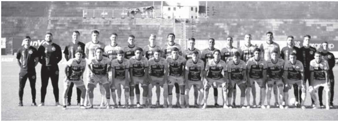
Piazada do Ninho confiante na classificação | ASSESSORIA