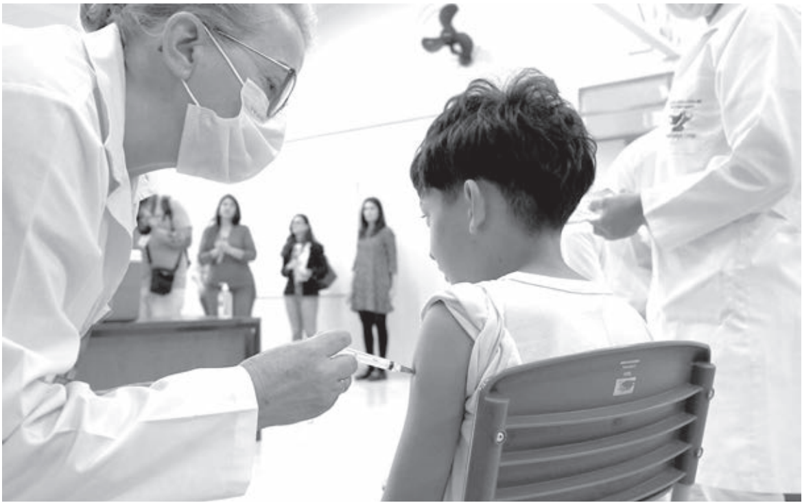
A ação foi prorrogada e segue até o dia 31

A vacinação é realizada com a autorização dos pais ou responsáveis, mediante a assinatura de um