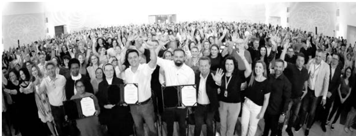
R$ 100 milhões serão destinados à reforma de colégios e outros R$ 120 milhões para a compra de aparelhos de ar condicionado, lava louças e fornos

“A educação se faz com investimento. São investimentos em infraestrutura, para dar condição de trabalho aos nossos professores, diretores e funcionários, e investimentos na nossa equipe, seja com os materiais didáticos, as formações continuadas ou com o reconhecimento. Todo este trabalho tem como resultado o excelente desempenho que o Paraná alcançou no Ideb”, disse o secretário de Educação, Roni Miranda.