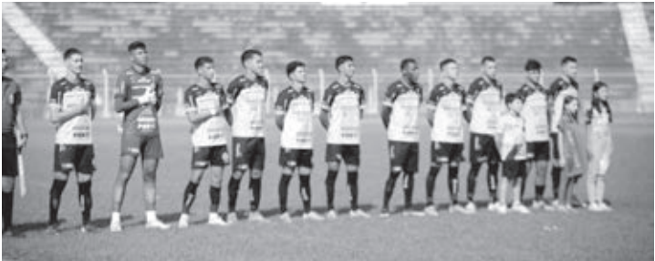
Piás do ninho vão em busca do título da Copa Sul