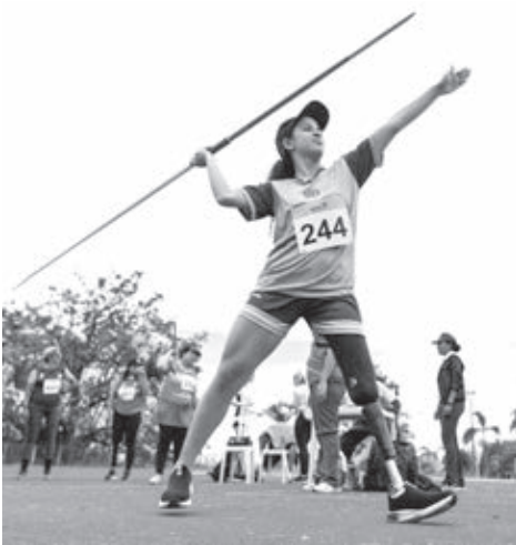
Paratletas de Cascavel preparados para a disputa