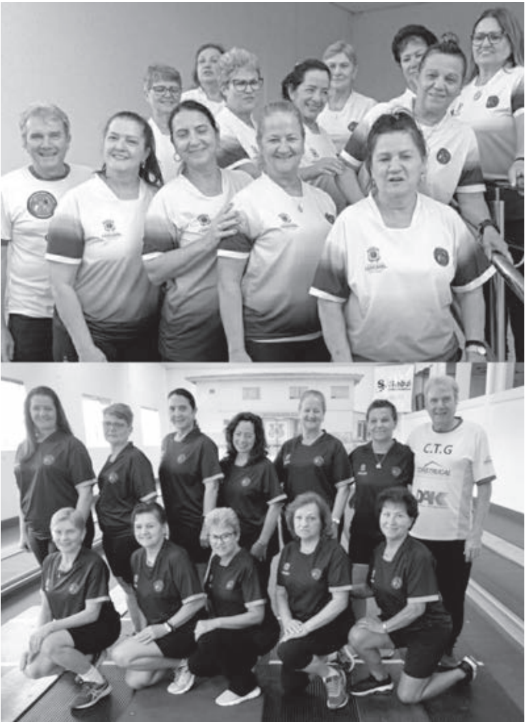
Equipes femininas miram títulos em competições nacionais | REDES SOCIAIS

Atiradores, em Dois Irmãos (RS). O campeonato inicialmente era para acontecer em maio, mas devido às enchentes foi transferido para agosto. A competição contou com a participação de 14 equipes, divididas entre três estados: Rio Grande do Sul, Santa Catarina e Paraná. Entre as equipes gaúchas estão: Dois Irmãos, Ijuí, Lajeado, São Leopoldo, Picada Café e Santa Maria). Santa Catarina será representada por Blumenau, Timbó, Rio do Sul, Joinville e Canoinhas. Já o Paraná terá como representantes as equipes de Marechal Cândido Rondon, Campo Mourão e Cascavel. O fim de agosto promete ser agitado e cheio de emoções para atletas e torcedores da modalidade na cidade.