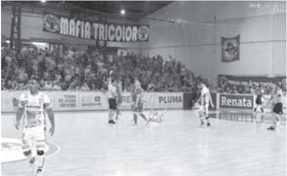
Torcida liberada deve fazer a diferença | ASSESSORIA

A vitória sobre o Marreco Futsal, na última quarta-feira (21), pela Série Ouro do Paranaense, levou o Cascavel à liderança da competição com 24 pontos, garantindo mais tranquilidade para a sequência do campeonato. No entanto, o foco agora é melhorar a posição na Liga Nacional. Atualmente, o Cascavel ocupa a 12ª colocação na Liga Nacional, com 25 pontos, e precisa estar entre os 8 primeiros para garantir a vantagem de decidir em casa na fase de mata-mata. Com três jogos restantes, o primeiro e mais difícil desafio será neste sábado (24), no Ginásio da Neva, contra o Carlos Barbosa (RS), que ocupa a 5ª posição. Nas duas últimas rodadas, a Serpente Tricolor enfrentará equipes catarinenses: no dia 31/08, joga contra o São Lourenço fora de casa, e na última rodada, em 07/09, receberá o Blumenau, que já está rebaixado.