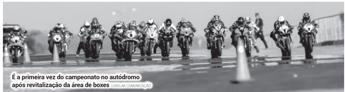
É a primeira vez do campeonato no autódromo após revitalização da área de boxes | GRELAK COMUNICAÇÃO