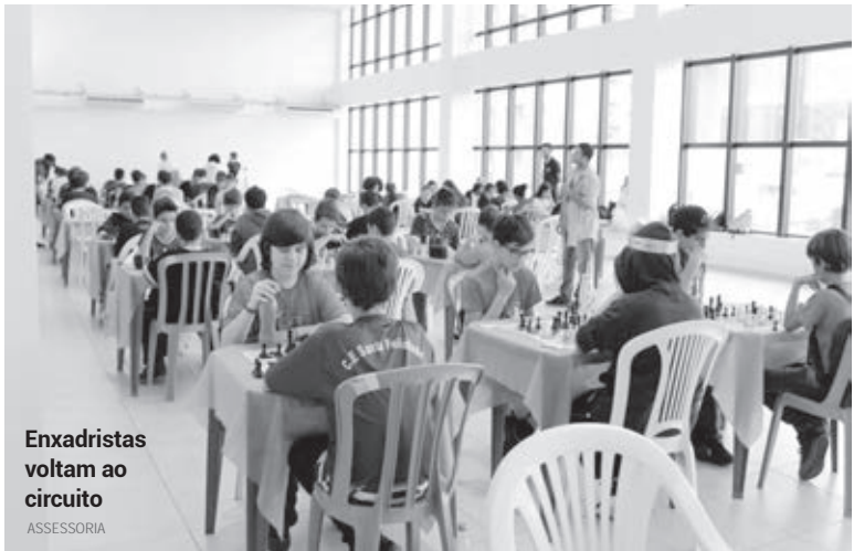
Enxadristas voltam ao circuito ASSESSORIA

Paranaense é o campeonato mais difícil do Brasil, mas é nossa obrigação brigar pelo título. Já a Liga Nacional é um pouco mais complicada, mas vamos lutar pelo título também”, assegura. Ele ainda reforça a importância de decidir os jogos em casa, contando com o apoio da torcida: “Temos um fator casa muito importante. Se formos classificados para decidir em casa no primeiro mata-mata, isso é super importante para a torcida. Nossa força é a Neva, nossa força é a torcida. Se trouxermos esses jogos para dentro de casa, acredito que vamos longe”, concluiu.