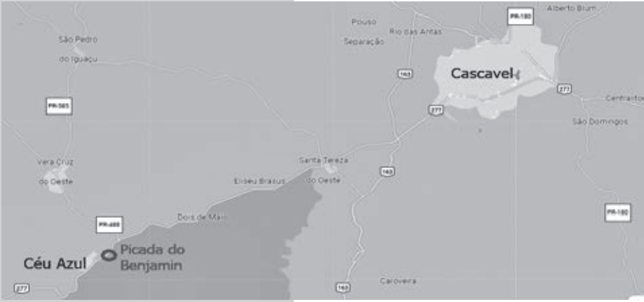
A Picada do Benjamin se ramificava a partir da atual Céu Azul

Deixando Guarapuava, a coluna legalista seguiu para Colônia Mallet, hoje Laranjeiras do Sul, onde o comandante Dilermando Cândido de Assis decidiu marchar na direção de Santa Helena. Até Laranjeiras havia mapas e roteiros indicativos, mas as notícias telegráficas vindas de Foz do Iguaçu indicavam dificuldades para cumprir a estratégia de alcançar a fronteira e prender os chefes rebeldes, dando fim à revolução. Até chegar a Mallet, a intenção de Dilermando era alcançar Catanduvas e daí seguir até Foz do Iguaçu, segundo o plano inicial. Informado de que os revolucionários estavam na iminência de chegar ao Noroeste do Paraná, Dilermando decidiu sair da rodovia estratégica e penetrar pelo desconhecido sertão paranaense. Optou por se deslocar a Santa Helena depois de receber um telegrama do prefeito de Foz do Iguaçu, Jorge Schimmelpfeng, que o deixou muito preocupado. Avisava que a Picada Benjamin estava intransitável para automóveis depois das últimas chuvas: “Como conhecedor terreno permito-me liberdade opinar que caminho Santa Helena além estar melhor estado encurtaria viagem”.