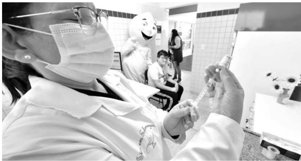
A vacinação acontece a partir da autorização dos pais ou responsáveis, após a assinatura de um termo de consentimento

O secretário de Educação, Roni Miranda, também ressaltou a importância da imunização. “Doenças infecciosas podem prejudicar não somente a saúde