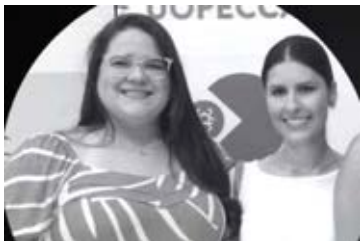
As médicas residentes de oncologia da Uopecan de Cascavel, seguiam para o RJ onde visitariam familiar doente