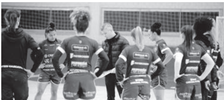
Stein quer reabilitação | ASSESSORIA