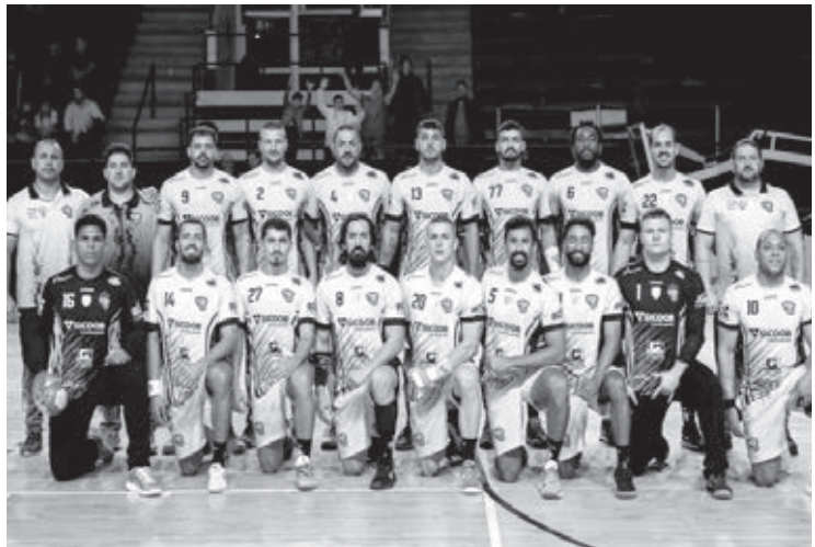
Handebol masculino entra em quadra

O time de handebol masculino de Cascavel garantiu sua vaga na próxima fase da Liga Nacional após uma vitória por 24x22 em casa, contra a equipe de Guarulhos, pela Conferência Sul/Sudeste, no fim de semana. Com esse resultado, o Cascavel mantém sua invencibilidade em casa, consolidando uma ótima campanha na competição até agora. Já com o passaporte carimbado para a próxima fase da Liga Nacional a equipe entra em quadra neste domingo (18), às 13:00 contra São Carlos (SP).