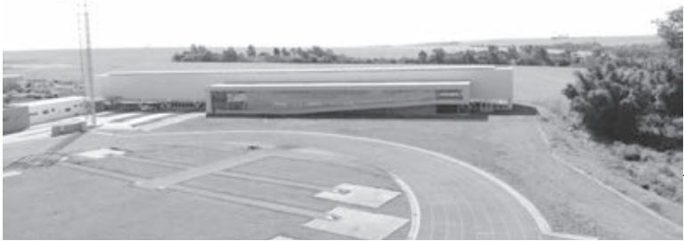
"Centro Nacional de Atletismo precisa ser melhor utilizado" | PARANÁ ESPORTES