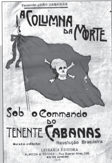
A Coluna da Morte, livro de João Cabanas

Um terço dos militares paulistas, do Exército Brasileiro e da Força Pública se rebelaram. “Após ganhar o controle da capital do Estado, os revoltosos marchariam até o Rio de Janeiro, para depor o presidente Artur Bernardes, aliando do poder não somente a pessoa que consideravam inimiga do Exército, mas também todo o estamento político que era representado por ele: as corruptas oligarquias regionais que colocavam seus interesses particulares acima dos nacionais e utilizavam os instrumentos burocráticos do Estado para auferir benefícios privados” (Mateus Fernandez Xavier, A Coluna Prestes e a Política Externa Brasileira na Década de 1920 ).