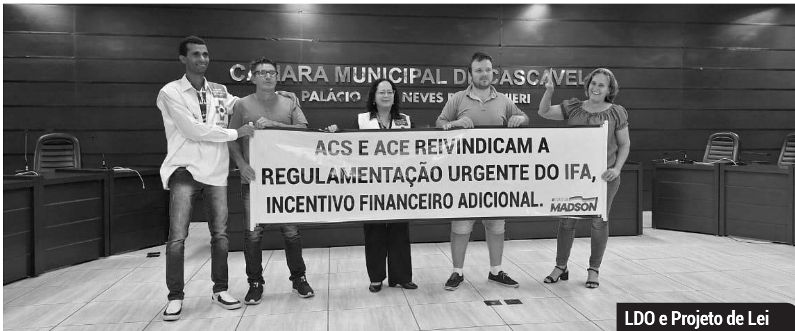
LDO e Projeto de Lei

Reunião cobrou soluções ao impasse que se arrasta por anos | SINDACS/PR