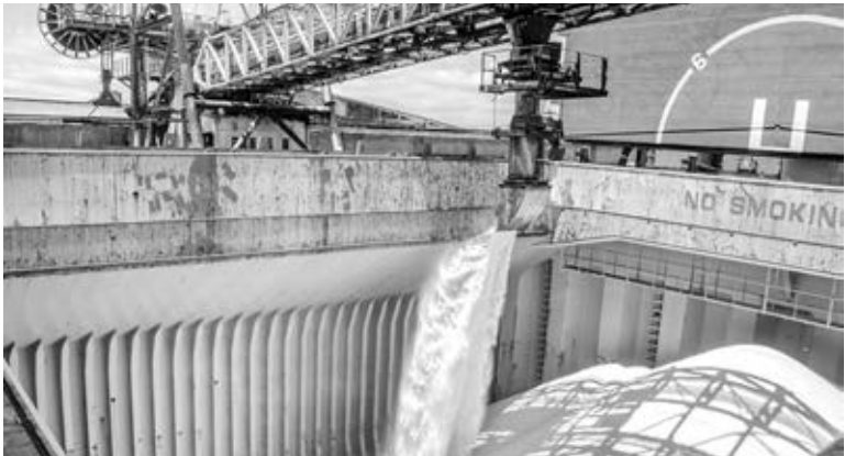
Exportação de açúcar a granel

No caso do mercado africano, as exportações estaduais saltaram de US$ 499 milhões para US$ 586 milhões no 1º semestre do ano, com destaque para o Egito, a África do Sul e a Argélia que atingiram US$ 112 milhões, US$ 83 milhões e US$ 71 milhões em compras, respectivamente.