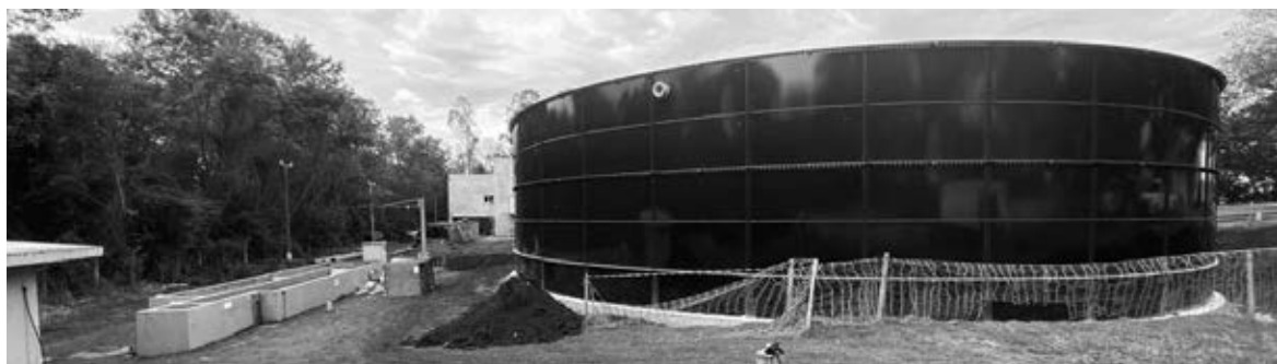
A Estação de Tratamento de Itaipulândia está sendo modernizada para receber o esgoto coletado em Missal | SANEPAR

Até meados de 2025, serão implantados mais de 52 quilômetros de rede coletora, duas unidades de bombeamento e 12 quilômetros de tubulações que levarão o esgoto coletado até a estação de tratamento. Para essas obras, serão investidos R$ 19,44