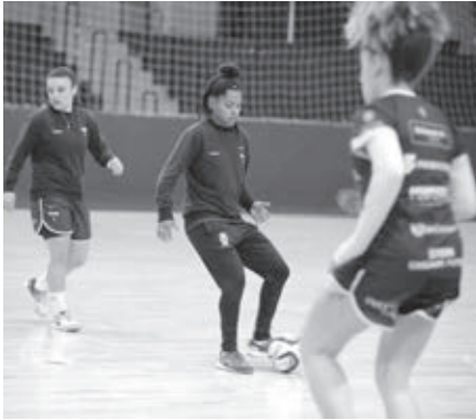
Stein quer a liderança | ASSESSORIA