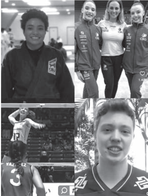
Atletas de Toledo em Paris 2024

O plano de governo para o esporte e lazer de Cascavel é uma iniciativa abrangente que visa atender as necessidades da população e promover o desenvolvimento esportivo da cidade. Com uma abordagem descentralizada, parcerias estratégicas e a nomeação de gestores qualificados, o objetivo é transformar o esporte em uma ferramenta de inclusão social e melhoria da qualidade de vida”, concluiu Rizzotto.