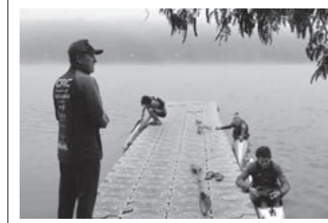
O frio não assusta nossos canoístas