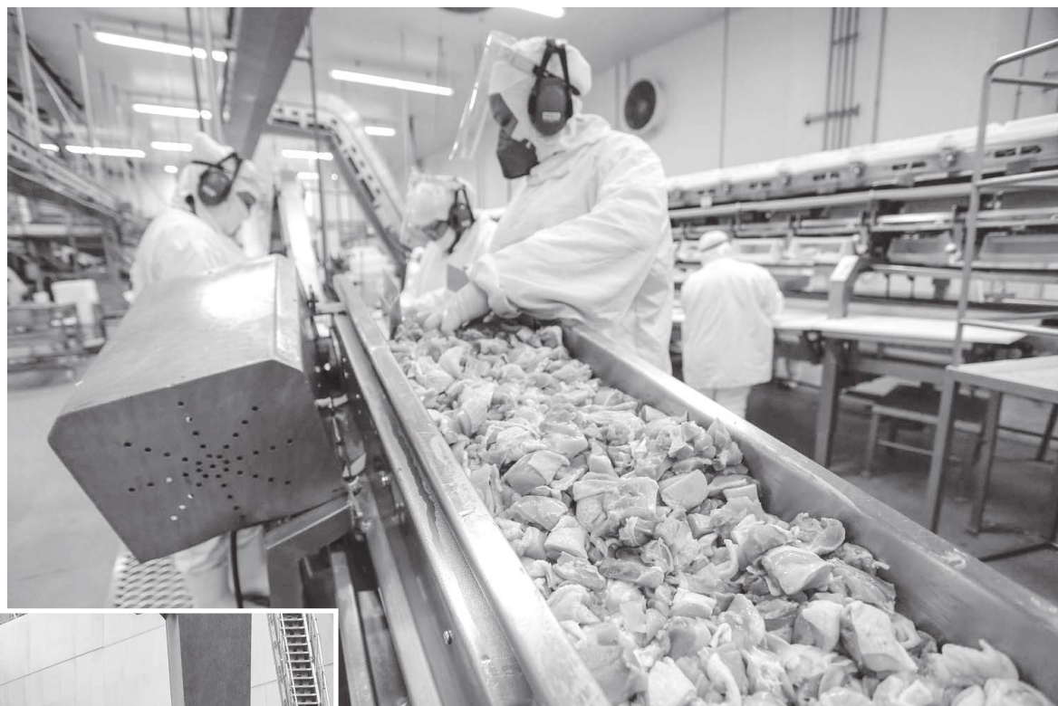
Carnes mantêm protagonismo nas vendas externas, com forte influência da avicultura

O economista Rui São Pedro avalia que o desempenho expressivo reflete não apenas a força do agronegócio regional, mas também uma reconfiguração do comércio global, impulsionada pela disputa comercial entre Estados Unidos e China, que abriu espaço para o Brasil ampliar sua presença em mercados estratégicos.