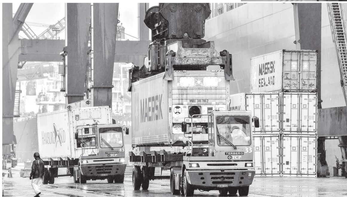
China segue c como maior parceiro comercial sob alerta de especialistas da necessidade de diversificar mercados