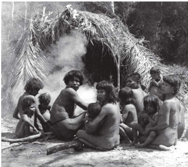
Índios Xetás que vivem no Paraná

Muitos desses lotes de fato concedidos pela Prefeitura foram depois grillados pela Gang da Terra (Preto no Branco, nº 288) após a queima da Prefeitura. A ditadura que em 1964 veio com a promessa de punir os grileiros na verdade os acobertou e a impunidade prevaleceu.