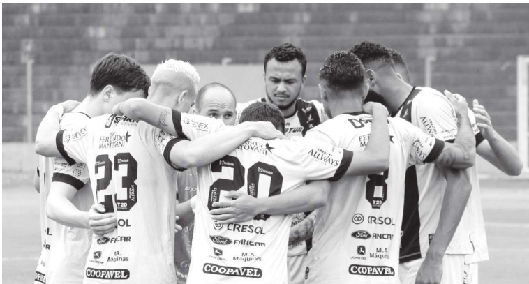
Elenco do FC Cascavel durante a preparação física de 50 dias para o Campeonato Paranaense 2026

Nova fórmula de disputa, calendário apertado e margem de erro praticamente zero. Este é o cenário do Campeonato Paranaense 2026, que teve seu pontapé inicial já na terça-feira (6), na partida entre São Joseense x Galo Maringá. A