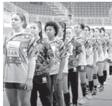
Meninas do Handebol querem vaga nas semifinais | ASSESSORIA

As equipes de handebol masculino e feminino entram em quadra neste fim de semana pela Série Ouro Adulto. O time feminino enfrenta neste sábado (03) a equipe de Pato Branco para carimbar a sua passagem às quartas de final, já que está na 2ª colocação na tabela de classificação e assim deve ficar. No domingo (04), entra novamente em quadra, já buscando a vaga para as semifinais, enfrentando provavelmente a equipe de Jardim Alegre, que no momento é a 7ª colocada. O time masculino o confronto é contra a equipe de Colorado. O time cascavelense está na liderança e deve enfrentar nas semifinais a 8ª colocada que atualmente é Assis Chateaubriandt.