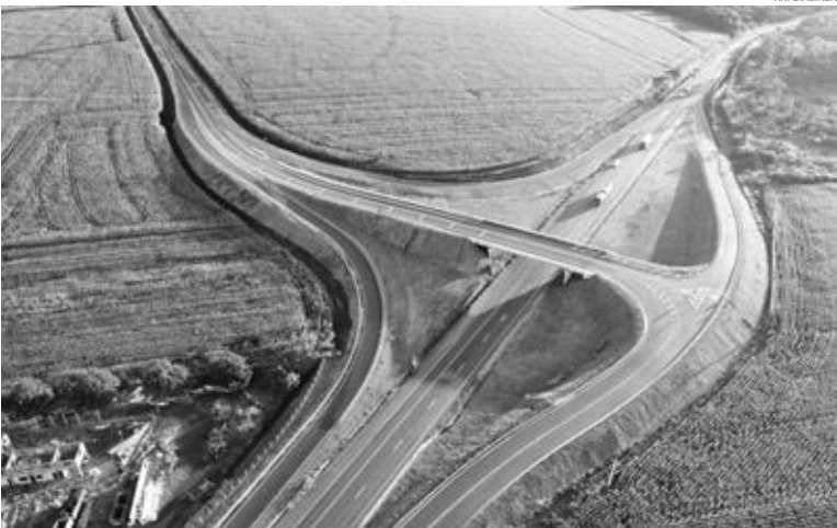
Na foto, Contorno Oeste de Marechal Cândido Rondon

Sediada em Cascavel, a Superintendência Regional Oeste, conta com dois escritórios no Sudoeste: Escritório Regional Centro Sudoeste, em Francisco Beltrão, e Escritório Regional Vale do Chopim, em Pato Branco. Ao todo, somando obras, conservação, manutenção e atendimento ao usuário, a Superintendência