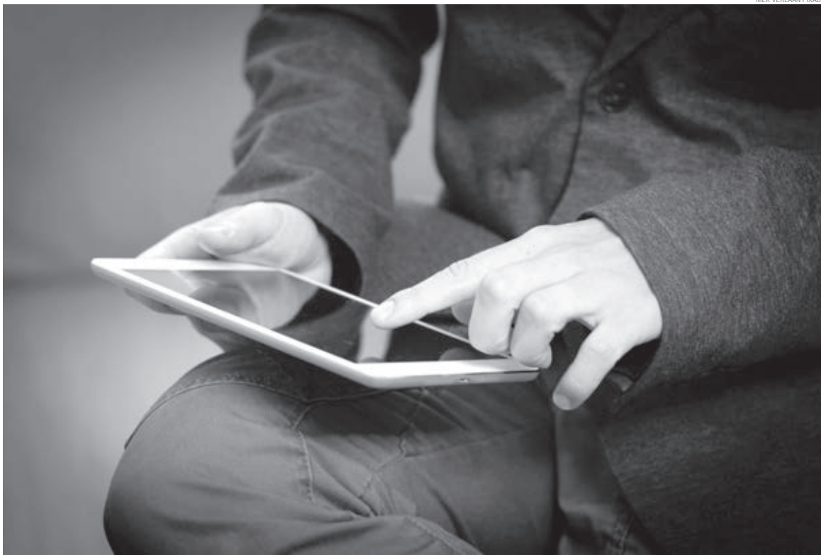
Prefeitura diz que dados podem ser completamente acessados pelo portal da transparência

Desde que o assunto começou a ser abordado pela reportagem, em 1º de julho, houve três diferentes respostas protocolares fornecidas pela comunicação oficial da prefeitura. A primeira indagação foi formalizada em 1º de julho, e a primeira resposta chegou no dia 15, quando a gestão de Leonaldo Paranhos negou o acesso à lista das empresas e valores beneficiados pela renúncia fiscal do Município, citando a proteção de informações pela LGPD. Esse argumento, no entanto, não se sustenta por recomendações do Tribunal de Contas do Estado (TCE-PR) e do