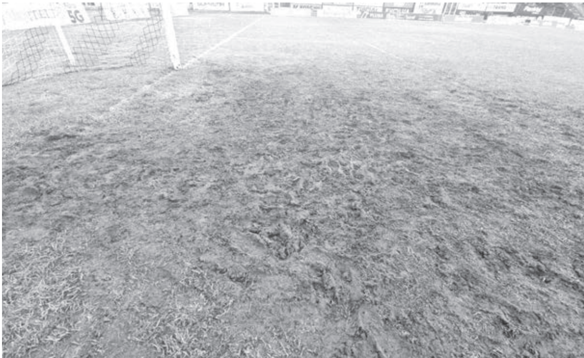
Gramado destruído | ASSESSORIA

preparando a equipe, comentou sobre o desafio: "Mesmo não jogando em casa, precisamos tentar construir um placar favorável para levar uma vantagem para o segundo jogo, que será na casa do Operário, e assim garantir nossa vaga na final".