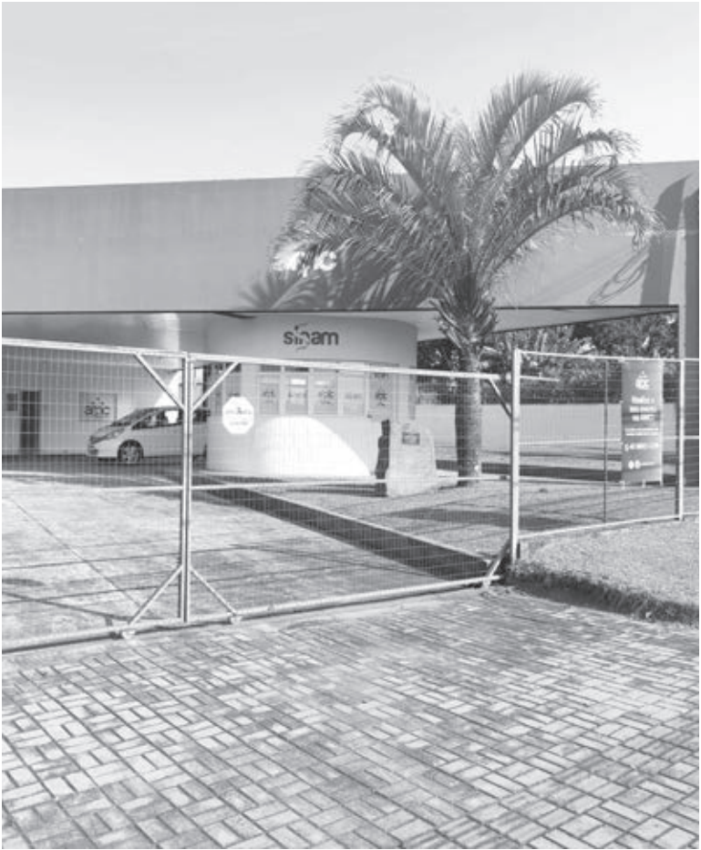
Terreno onde está sede da Associação Médica e regional do CRM-PR é alvo de denúncia

A Associação Médica de Cascavel foi procurada e até o fechamento desta edição não havia se pronunciado. O espaço segue aberto às manifestações.