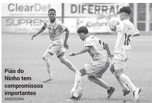
Piás do Ninho tem compromissos importantes | ASSESSORIA