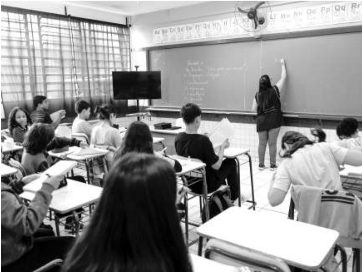
As vagas a serem ocupadas são para carga horária de 20 horas, mas os candidatos aprovados em dois cargos

tomar posse em janeiro, enquanto outros 1.106 tiveram os seus decretos de nomeação assinados em maio.