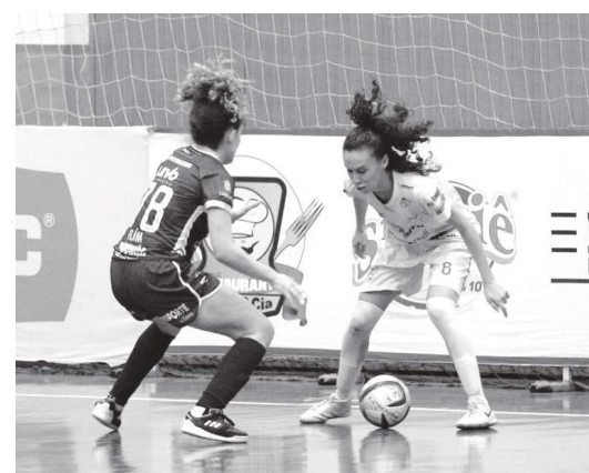
Importante se manter na ponta | ASSESSORIA

Os dois primeiros colocados na 1ª fase avançam direto para as semifinais, as outras 4 equipes disputam 2 vagas com jogos entre o 3º contra o 6º e o 4º contra o 5º, saindo daí as outras duas equipes finalistas.