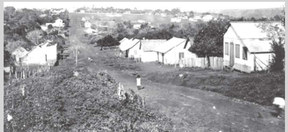
Os revolucionários encontraram a cidade de Foz do Iguacu praticamente deserta

Eles cautelosamente alcançaram Foz do Iguacu, onde seria lógico haver alguma resistência, mas em 5 de outubro tudo que