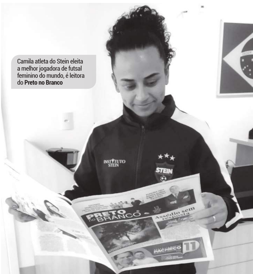
Camila atleta do Stein eleita a melhor jogadora de futsal feminino do mundo, é leitora do Preto no Branco