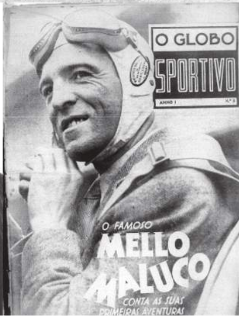
Helberto Schwarz: inocentado do incêndio e reconhecido como bom administrador. Ministro da Aeronáutica nos anos 1950, na juventude Mello Maluco era famoso por suas acrobacias aéreas