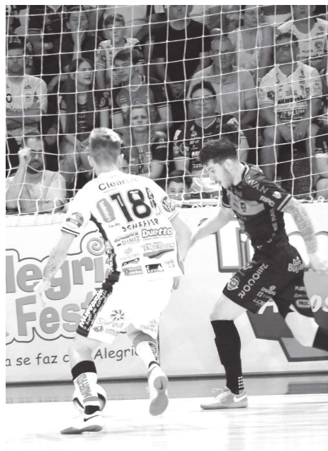
Pela LNF primeiro jogo contra o Pato será na Neva | ASSESSORIA

O Cascavel Futsal perdeu a oportunidade de garantir alguns dias de descanso e preparação focada para os duelos da Liga Nacional contra o Pato Futsal. Tropeços durante a primeira fase da Série Ouro tiraram da equipe a chance de classificação direta para as quartas de final, obrigando o time a disputar mais dois jogos nas oitavas para seguir no campeonato. Agora, o Cascavel enfrenta o Chopinzinho 12º colocado, na primeira partida das oitavas de final, marcada para segunda-feira (07). Além disso, o time terá pela frente dois confrontos importantes pela Liga Nacional contra o Pato Futsal: o primeiro jogo será no sábado (12), às 20h, no Ginásio da Neva, em Cascavel, e o segundo no domingo (20), às 11h, no Ginásio Dolivar Lavarda, em Pato Branco. O jogo de volta da Série Ouro acontece no dia 23 de outubro, às 20h, também no Ginásio da Neva. Caso avance para as quartas de final do Paranaense, o Cascavel enfrenta o Guarapuava. Os demais confrontos das oitavas ficaram definidos como Esporte Futuro x Mariópolis, Operário de Laranjeiras x Foz Cataratas e Marreco x São Miguel.